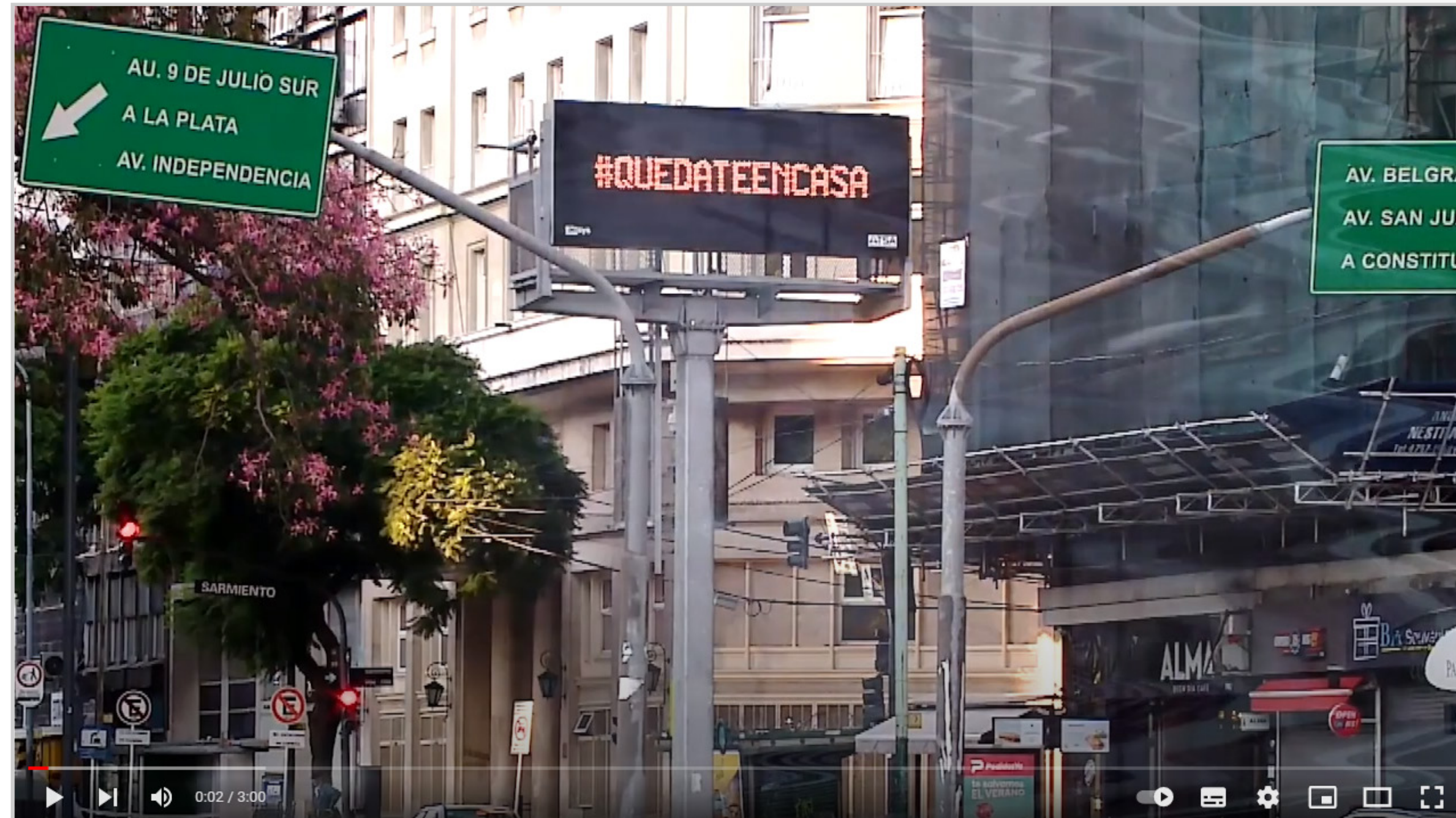
Docentes que inspiran (Video)