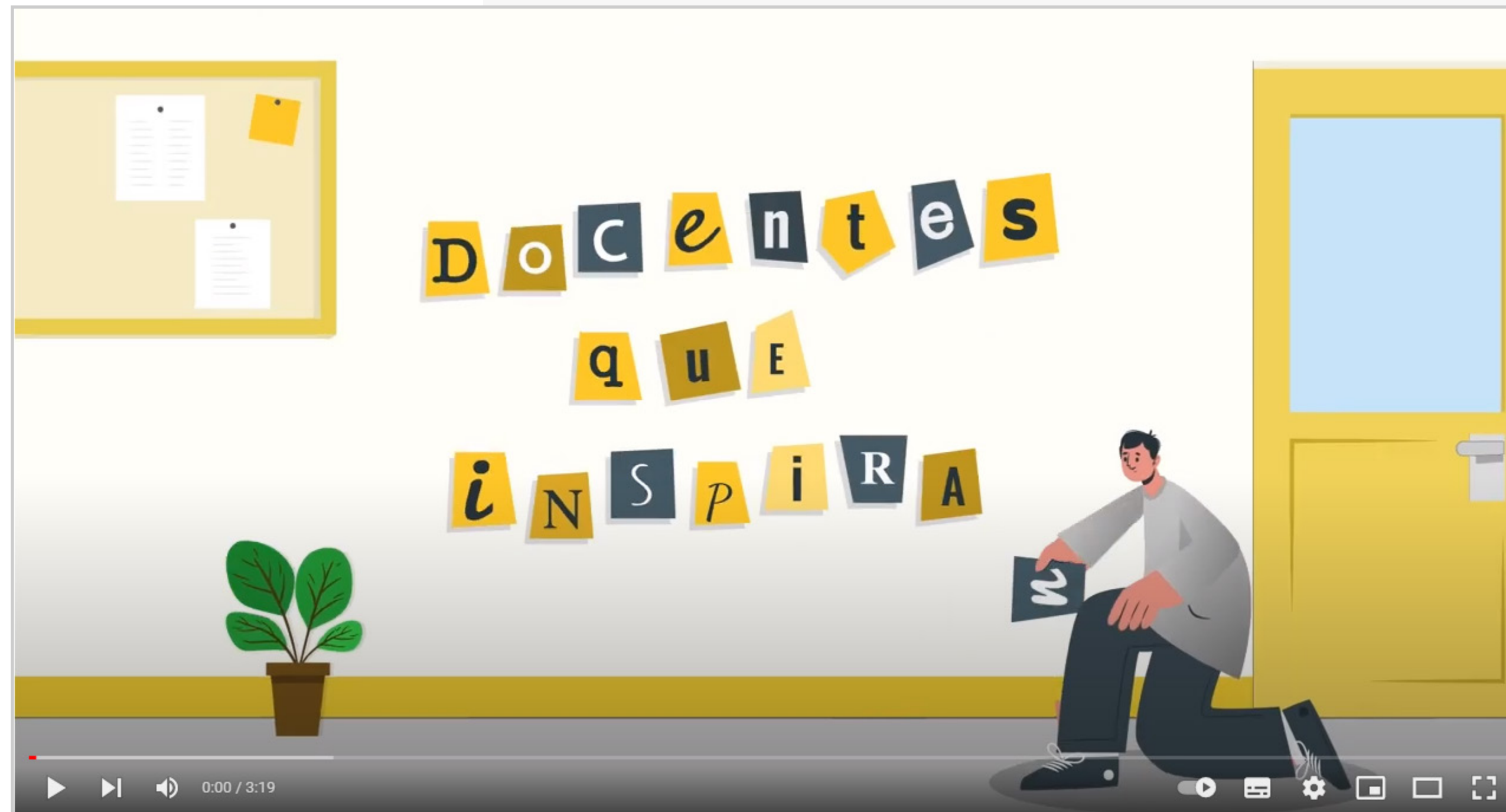
Resumen Docentes que Inspiran 2021 (Video)